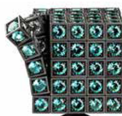
Vlad Glynn-Cubed Cube